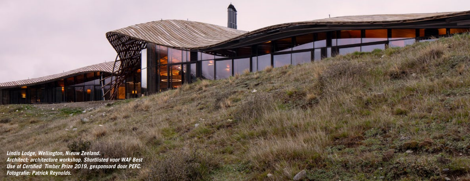
Lindis Lodge, Wellington, Nieuw Zeeland. Architect: architecture workshop. Shortlisted voor WAF Best Use of Certified Timber Prize 2019, gesponsord door PEFC.

Goossen Te Pas Bouw, onderdeel van VolkerWessels